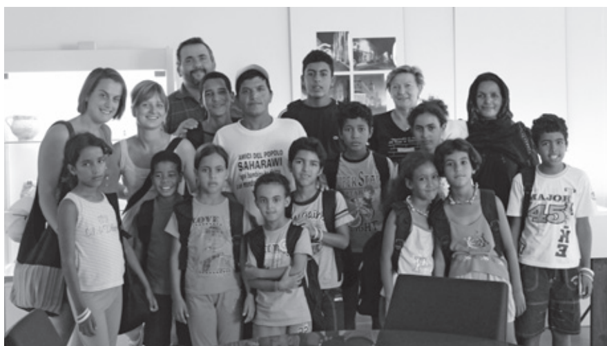
I ragazzi del Saharawi accompagnati dai volontari dell'associazione Pace e Solidarietà di Nonantola.

Lo scorso 23 agosto, in continuità con un progetto di solidarietà attivo da diversi anni, un gruppo di bambini e ragazzi del popolo Saharawi è stato accolto nel nostro paese dal sindaco Gatti che, in rappresentanza di tutta la cittadinanza, ha ricevuto gli ospiti in Municipio, in presenza del