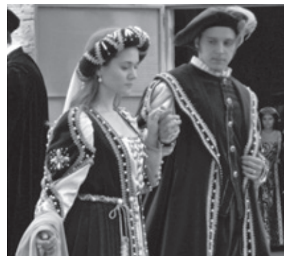
Gli attori in azione con i costumi d'epoca dell'associazione Dama Vivente di Castelvetro

Auspiciando che l'esperienza si possa ripetere nel 2012, perché sarebbe l'occasione per apportare al progetto tutti quegli aggiustamenti che si sono evidenziati necessari sperimentando la prima edizione,