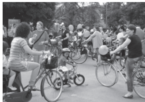
Le famiglie ricordano l'Unità con la bicicletata