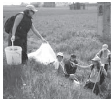
Pulizia del fosso in Via Carducci