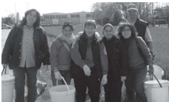
In posa per la stampa...