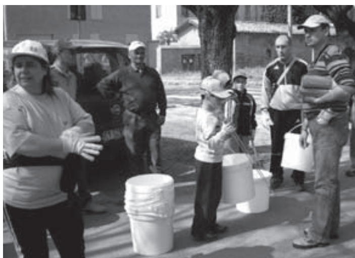
I preparativi: distribuzione di secchi e guanti

Proponiamo alcuni scatti dell'iniziativa Fiumi Puliti che si è svolta lo scorso 5 aprile, quando un folto gruppo di volontari ha ripulito alcuni dei fossi tra Ravarino e Stuffione. Non si può avere idea di quanto pattume venga gettato nei fossi e ai bordi delle strade finché non si prova ad andarlo a raccogliere. Ricordiamo che, ogni anno, per recuperare i rifiuti gettati fuori dai cassonetti e abbandonati sul territorio il Comune deve spendere circa 20.000 €.