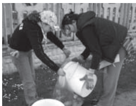
Dai secchi ai sacchi