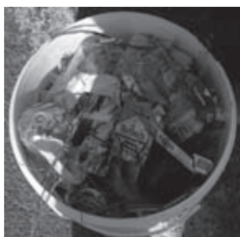
Un secchio pieno di rifiuti