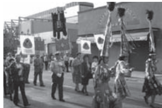
Un corteo dell'Avis a Ravarino