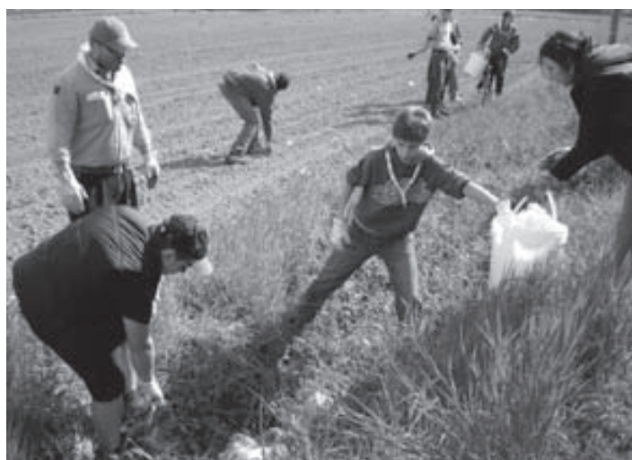
Pulizia del fosso in Via Dante