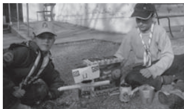
I materiali riciclabili diventano giocattoli