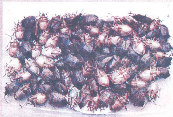
Cimici svernanti ritrovate in abitazione

e si nutre su un'ampia varietà di specie, coltivate e spontanee, in particolare Fabacee e Rosacee, con una predilezione per piante arboree e arbustive. Oltre ad essere pericolosa per le piante è anche molto fastidiosa perché entra con ingenti popolazioni nelle case per svernare. In Europa, fino ad oggi, era stata rinvenuta solo in Svizzera e nel Liechtenstein (2007); più di recente la specie è stata riscontrata anche in Francia.