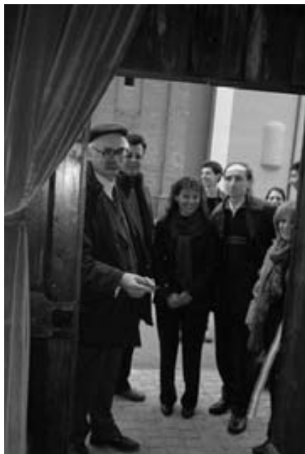
Inaugurazione di una mostra della Bottega degli Artisti