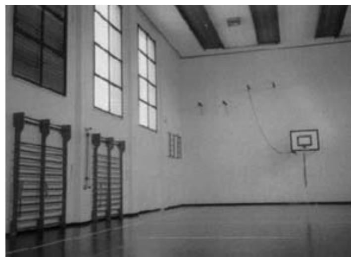
L'interno della palestra della scuola elementare