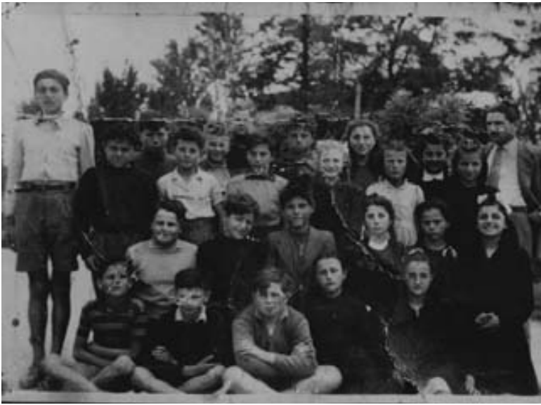
FOTO DI GRUPPO

Scuola elementare di Stuffione - anno scolastico 1946-1947.