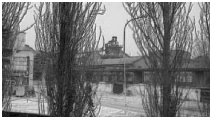
Una delle foto in mostra

Sabato 22 aprile 10,00/12,30 – 16,00/18,30 – 20,00/22,00